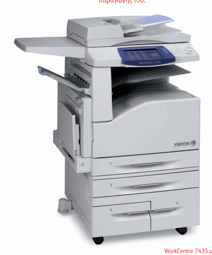
WorkCentre 7435 με Work Surface.